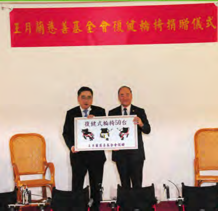
▲桃園八德榮民之家復健式輪椅捐贈儀式。