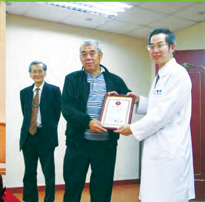
▲三軍總醫院基隆院區舉行輪椅捐贈感恩會，頒贈感謝狀予基金會，由許副執行長代表受贈。

能幫銀髮長者找到合宜的代步工具，同時又能兼顧復健功能，適巧臺灣奐和公司引進日本設計製造的復健式輪椅，符合基金會心中所想，因而向奐