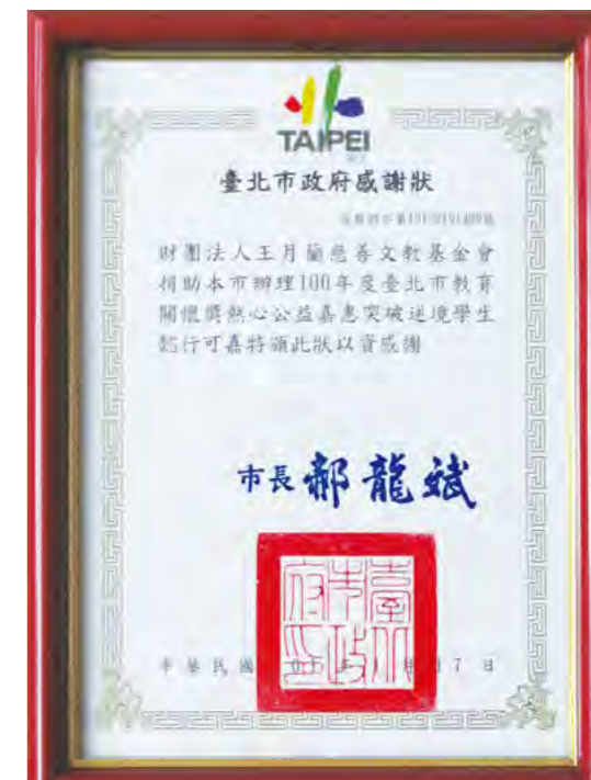
▼ 臺北市政府教育局頒贈之感謝狀。