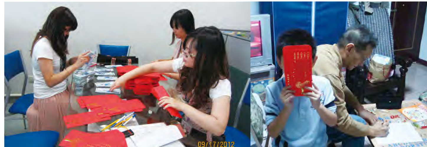
▼ 社工員發送紅包給弱勢家庭學童，協助學童順利開學。