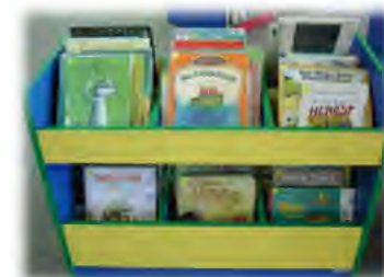
▲英語圖書除了在校閱讀，也能帶回家，與家人分享。▼

英語圖書及設備為主，包括150本英語圖書、電子白板、投影設備等並建置英語e化情境，讓學童在自然的英語環境中學習英文，下課後還可以將英語圖書帶回家閱讀，與家人分享，培育說英文的興趣。