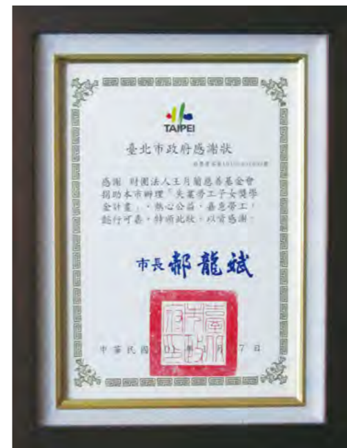
◀北市府頒發給基金會的感謝狀。

而101年年底，基金會再次挹注475萬元，支持102學年度獎助學金之開辦，期望這即時善款能緩解學生開學前的燃眉之急。