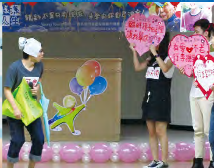
▲Young young精彩週年成果發表會上，青年小組「創」以戲劇分享於中壢火車站為老弱婦孺提行李、攙扶上下樓梯的經驗。