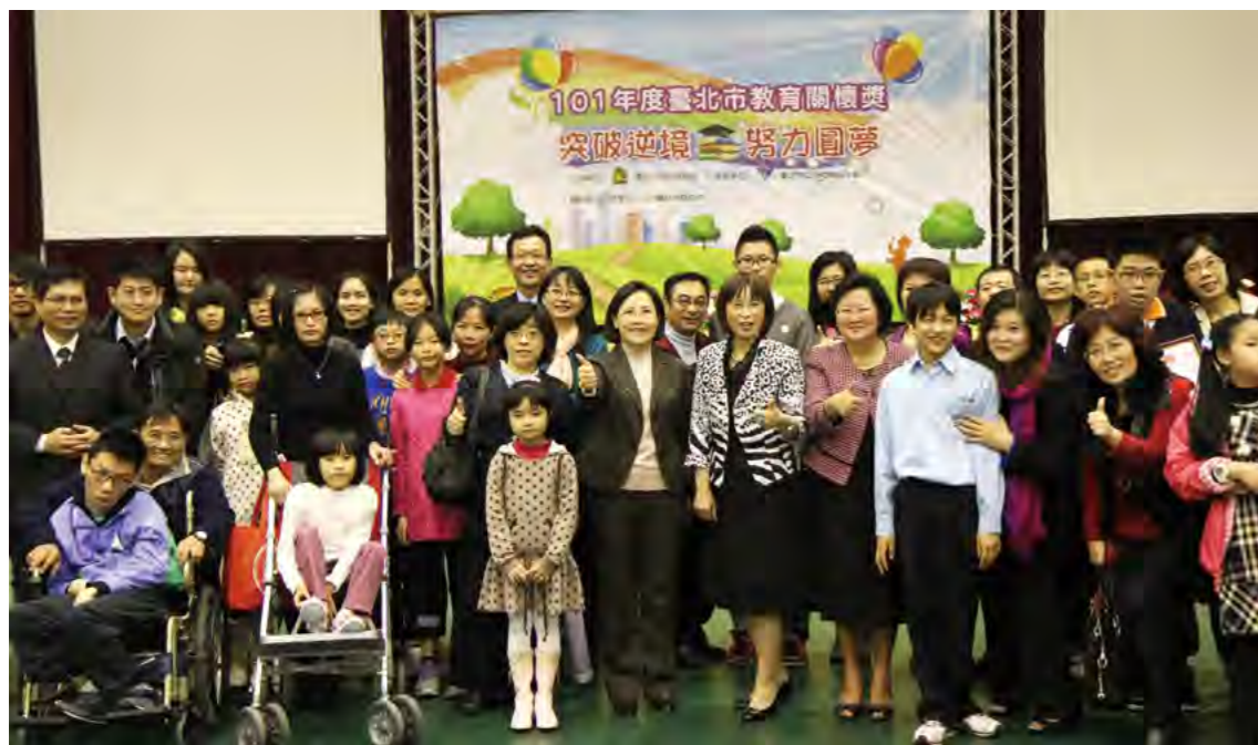
▼ 頒獎典禮會後合影

即便未獲選進入決賽，只要是經學校推薦的學生，就能獲頒7,000元（100年度）/ 10,000元（101年度）獎學金及獎狀乙紙；而決選出來的所有學生，除了原已頒發的獎學金及獎