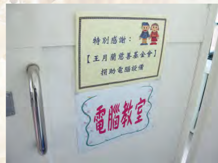
◀由王月蘭慈善基金會捐助之電腦教室開課囉！

正區忠勤里設置的電腦教學中心正可補足此缺塊，讓弱勢學童多一個學習實用技能的場所；且擴大成為提供貧弱家庭學童於放學後到夜間時段，能有一處兼具課輔、品德教育、愛心伴讀、諮商解惑及閱讀資訊的多功能之正當處所。