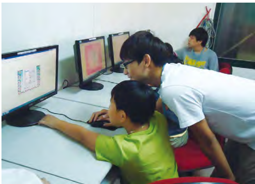
▲招募大學生志工為學生進行電腦教學課程。

其中於101年3月啓用的電腦教學中心，則由財團法人王月蘭慈善基金會捐款之50萬元，購置相關電腦設備，並將開辦國中、國小二個課後輔導班，招募大學生志工作為講師，每週