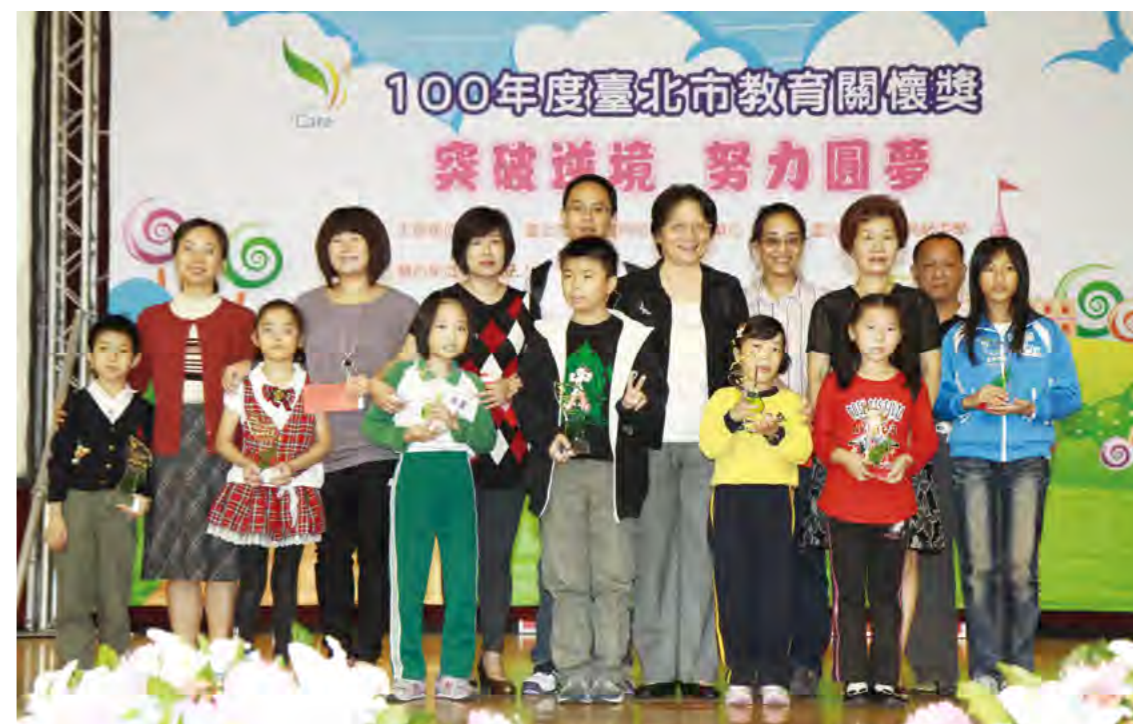
▼ 臺北市政府教育局丁亞雯局長與獲獎學生一同合影。

基金會100年首次贊助時，捐助了155.4萬，包辦122名入選者的7,000元獎學金；但在看過教育局舉辦的頒獎典禮及得獎學生所拍攝的影片後深受感動，101年度擴大贊助金額達220萬元，希望能鼓勵更多學生一起「突破逆境，努力圓夢」。