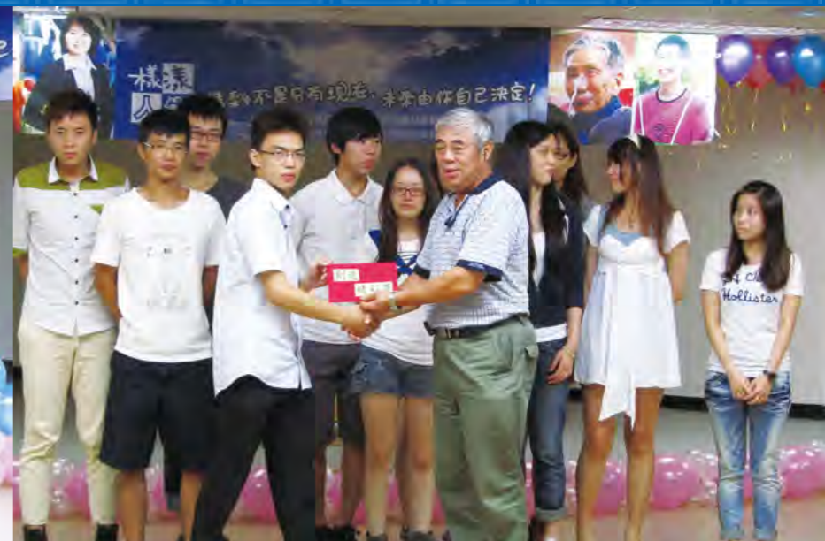
▲參與專案青年分成八小隊，以各種創意分享一年來的故事，會後票選出由「創」小隊榮獲「創造精神獎」，並由基金會許副執行長代表頒獎。

跑記者會，邀請基金會王文洋董事長及董事們出席，於會中接受郝龍斌市長表揚及頒發感謝狀。