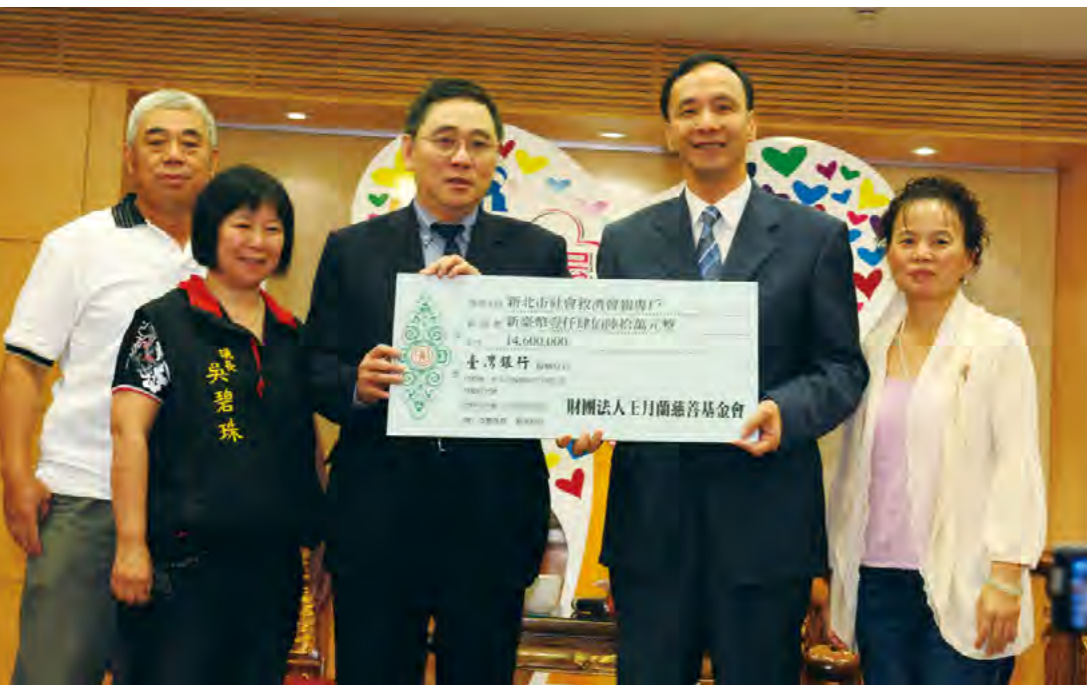
▲王文洋董事長代表基金會捐贈新臺幣14,600,000元（100年實物銀行+旭日生涯專案）支票，由新北市朱立倫市長接受捐款。

第一筆500萬元的捐款已於民國100年8月及9月發放完成，共計有829戶、1,330人受惠；而101年捐款的200萬元亦於9月發送，共計352戶、556人受惠。