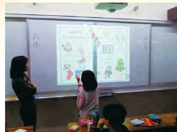
增添英語e化情境，結合生活與美語學習。

位於臺北市雙溪河畔的文昌國小，以優良的辦學成績深獲社區家長的信賴。不過受到近年來經濟不景氣的影響，全校約15%的學生屬於弱勢家庭，且分析學生的學習狀況發現，弱勢家庭學童因為家長終日忙於生計，沒時間或沒能力指導孩子學習英語，更有許多孩子受限於家庭經濟環境，無法參加補習班，甚至連學校老師免費架設的英語線上教學網站，也因為部分孩子家貧沒有電腦或網路，失去了在課後免費上線學習的機會，如